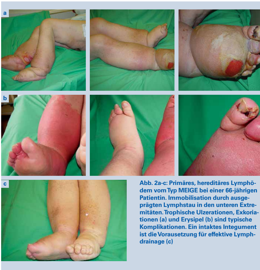
Abb. 2a-c: Primäres, hereditäres Lymphödem vom Typ MEIGE bei einer 66-jährigen Patientin. Immobilisation durch ausgeprägten Lymphstau in den unteren Extremitäten. Trophische Ulzerationen, Exkoriationen (a) und Erysipel (b) sind typische Komplikationen. Ein intaktes Integument ist die Voraussetzung für effektive Lymphdrainage (c)

Lymphgefäßsystem etwa in Analogie zur Phlebologie sind bislang nicht erfolgreich.